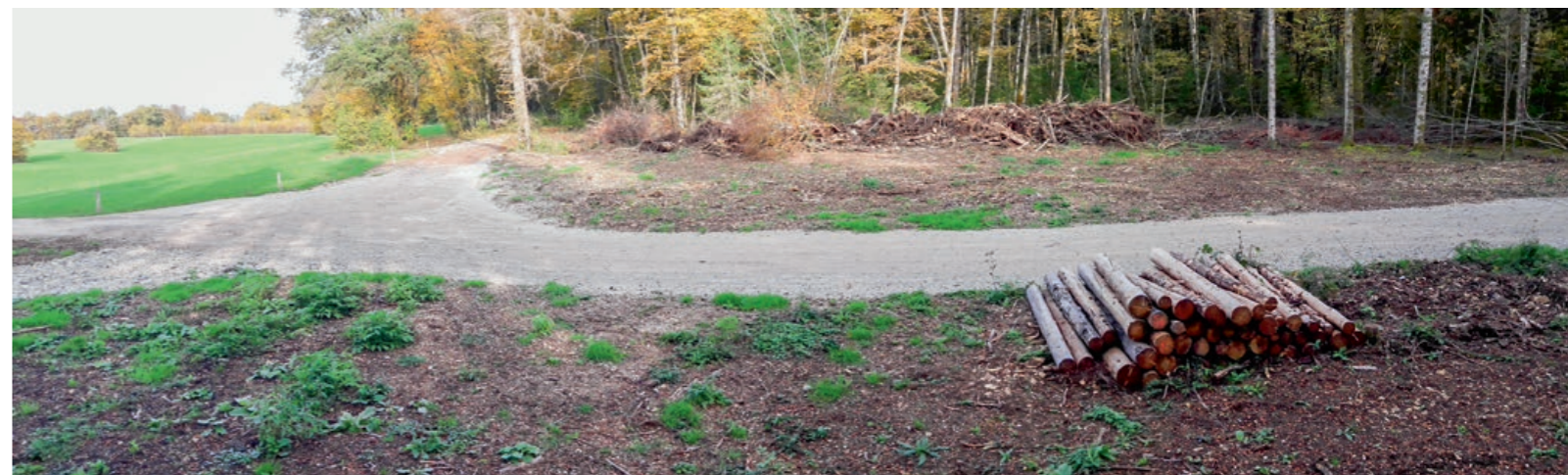
Place de retournement à Chassagne

Tous les petits nouveaux arrivants ont fait leur rentrée en douceur, pendant que les "grands" désormais en âge scolaire s'apprêtaient à découvrir l'école maternelle.