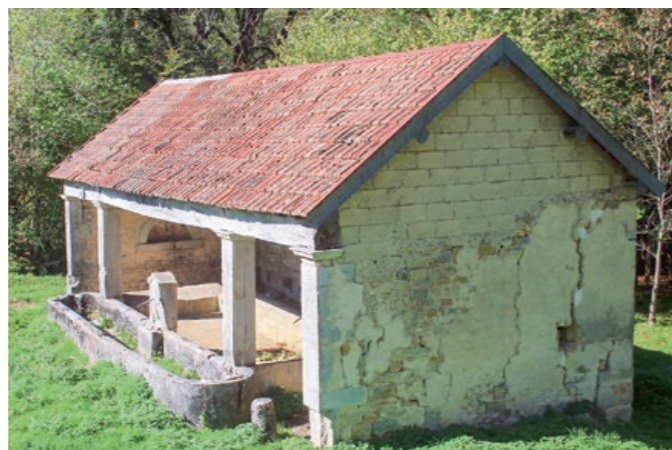
La fontaine avant restauration menaçait ruine

En fonction de la technicité exigée, les travaux ont été répartis entre entreprises spécialisées, association d'insertion, compagnons du devoir en formation et équipe bénévole. L'appropriation du projet par la population est une grande satisfaction, puisque plus d'une trentaine d'habitants motivés se sont ainsi impliqués sur le chantier ou sur l'animation de la souscription.