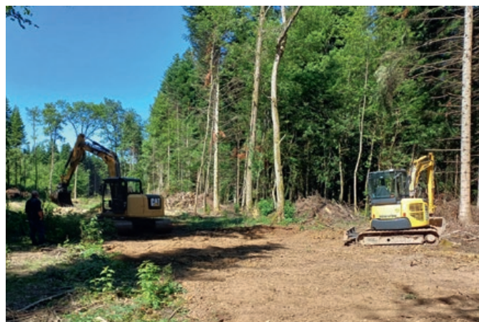
Comblement du lit en cours

Les travaux de drainages des eaux humides, de recalibrage des cours d'eau, associés aux plantations de résineux, ont dégradé le ruisseau et la zone humide, diminuant leur capacité d'accueil pour les espèces typiques de ces milieux et ne leur permettant plus de jouer le rôle de régulateur de la ressource en eau. Le changement climatique en cours aggrave les conséquences des travaux déjà réalisés sur ces milieux.