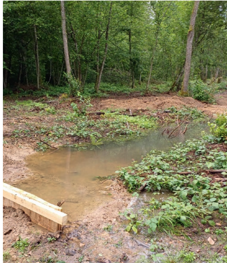
Bouchons étanches en madrier bois sur le lit à combler

À l'automne 2024, auront lieu des travaux spécialisés de bouturage de saules, de mise en place de bois mort dans le lit du cours d'eau (afin de diversifier les habitats) et éventuellement de réensemencement de certains secteurs.