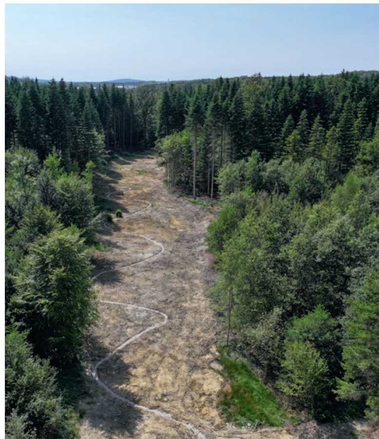
Vue aérienne du lit reméandré