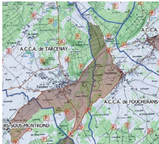
Carte des réserves de chasses des ACCA de Tarcenay et Foucherans